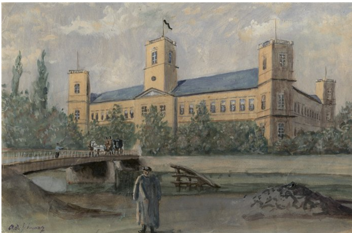
Veselský zámek v době První republiky